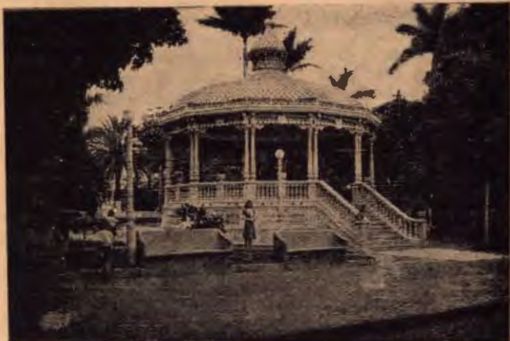
Bello kiosco en el Parque Central de Alajuela