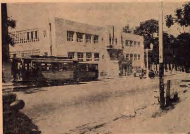
Bello edificio del Hospital San Juan de Dios situado en el Paseo Colón