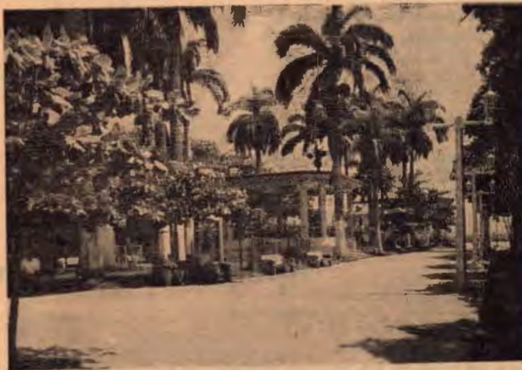
Uno de los costados del atractivo Parque de Puntarenas