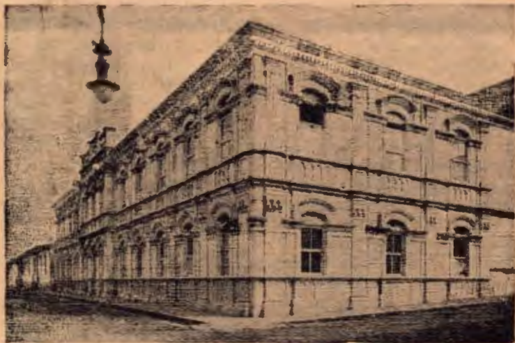
Elegante Edificio del Liceo de Heredia